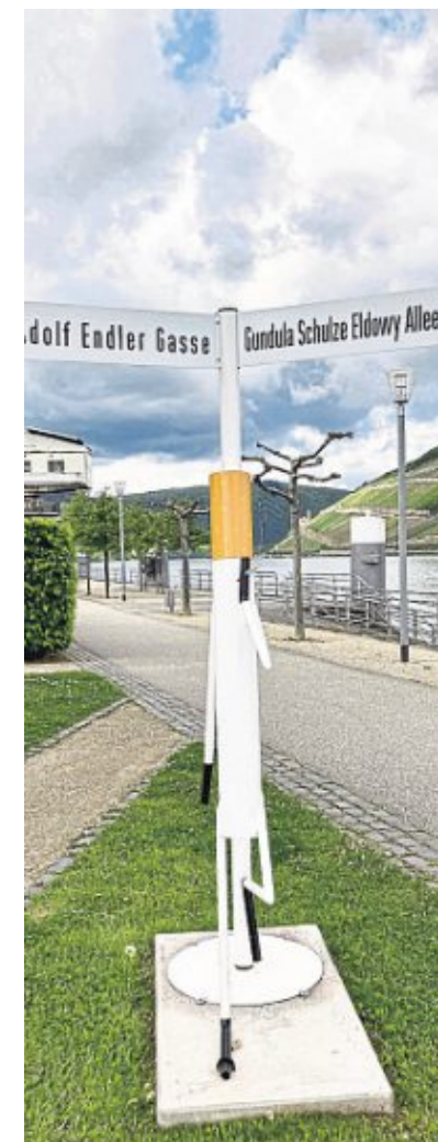
„An der Ecke“, lässig mit Zigarette, stammt von Wilhelm Klotzek.